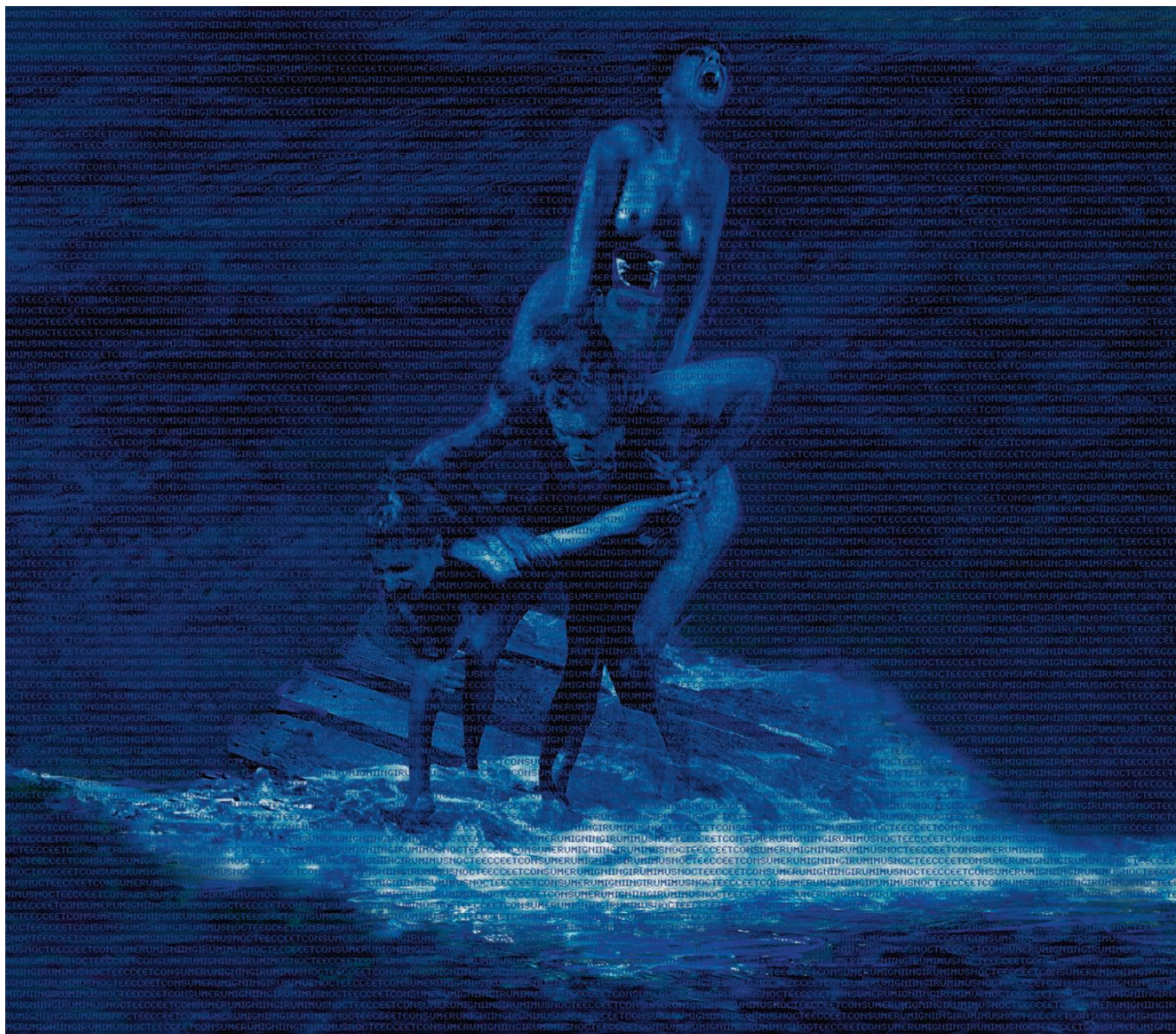
SALVADOR, In girum imus nocte (détail), 2013, tirage pigmentaire, 100 x 150 cm © Salvador

« Très tôt, pour des raisons de précisions, de réalisme et d'efficacité, la peinture a utilisé les moyens optiques : la "Camera Obscura" de Vermeer. Très tôt, la photographie a pris la peinture comme modèle : pictorialistes au XIX e siècle, photomontages surréalistes... Très tôt, photographie et peinture se sont mises en compétition.