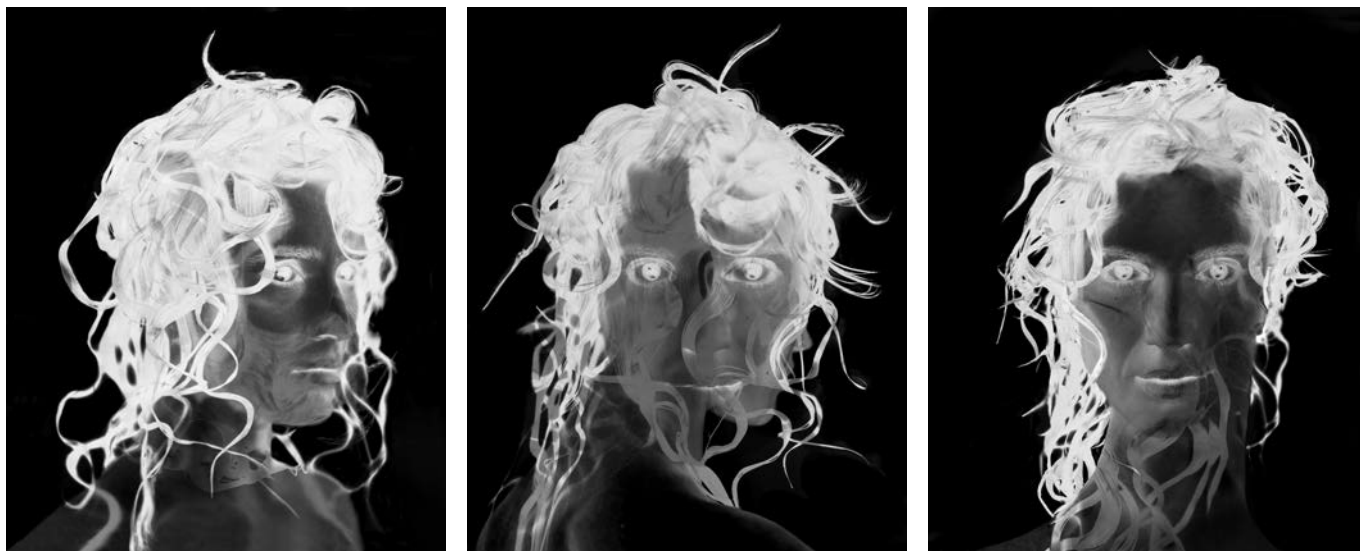
SALVADOR, Trois têtes antiques , 2013, ferrotypes, triptyque, 55 x 44 cm (chaque) © Salvador