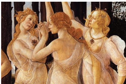
BOTTICELLI, Primavera (détail), 1482, tempera sur bois, 203 x 314 cm

« Salvador donne aux tableaux de grands maîtres les visages et les corps d'aujourd'hui. Le corps, nu, sublimé, de la femme plonge dans Le jardin des Délices de Jérôme Bosch. Méduse, Athéna et Vénus ont le même visage, seules changent leurs expressions comme si Janus, soudain portait un masque à trois têtes. Les trois grâces de Botticelli deviennent sculptures vivantes et figées par l'objectif. C'est une femme nue et ligotée dont