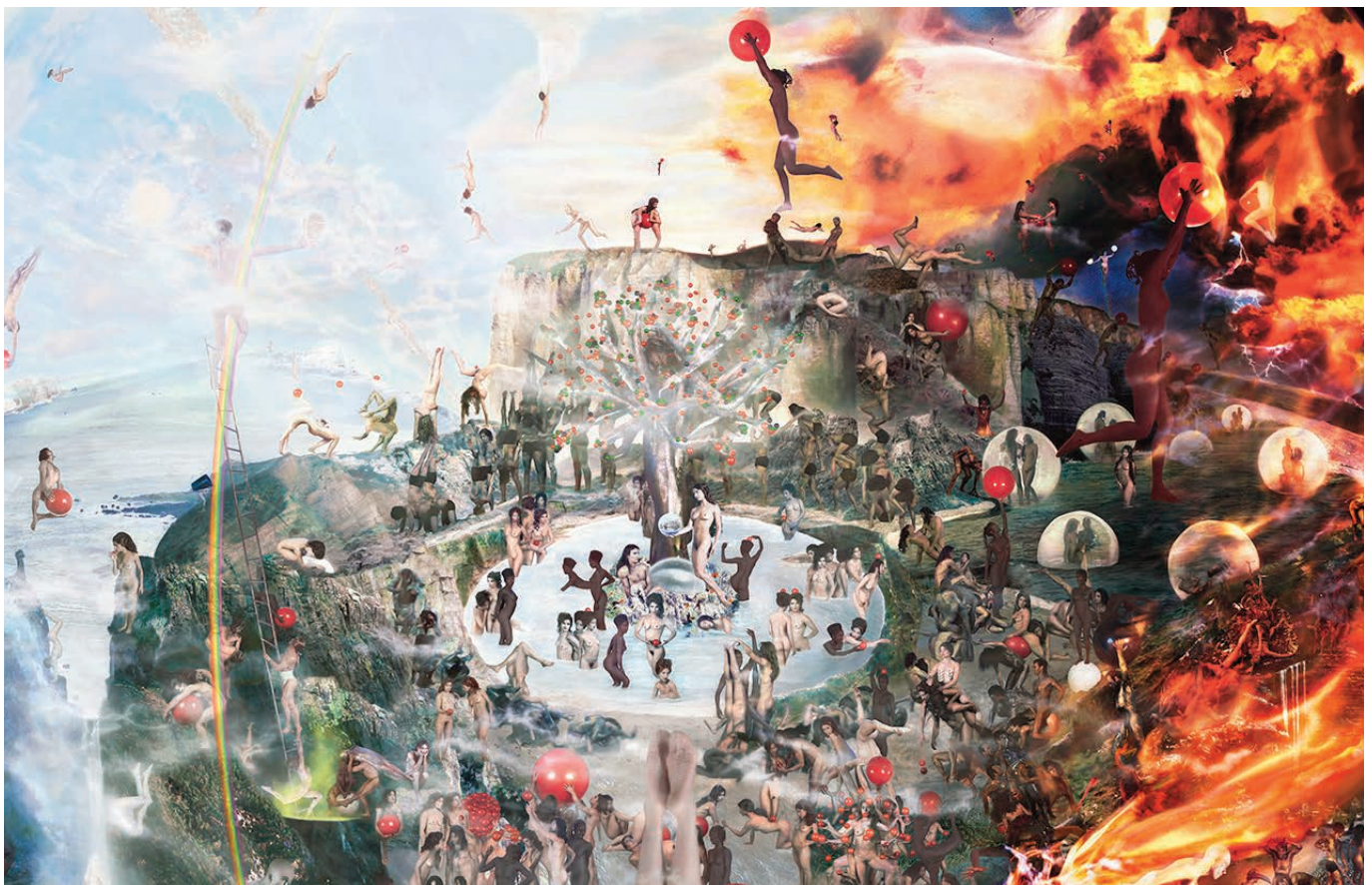
SALVADOR, Le jardin (détail), 2002, duratrans sur caisson lumineux, 180 x 180 cm © Salvador

Les corps qui ne sont plus que détroques, depuis longtemps devenues poussières des peintures et sculptures d'hier, sont remplacés par de nouveaux modèles. Les gestes n'ont pas changé, les expressions sont semblables dans l'œil de la caméra où notre époque se dissout et se fige dans l'instant. Demeure l'origine du monde : le corps nu et écartelé de la femme, douleur et volupté dans l'enfer du jardin d'Eden. » Lélia Mordoch